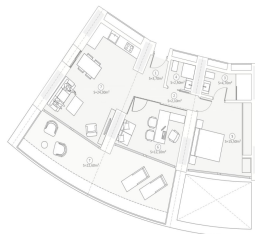
Tipología: 2 Dormitorios TIPO SUITE SALÓN